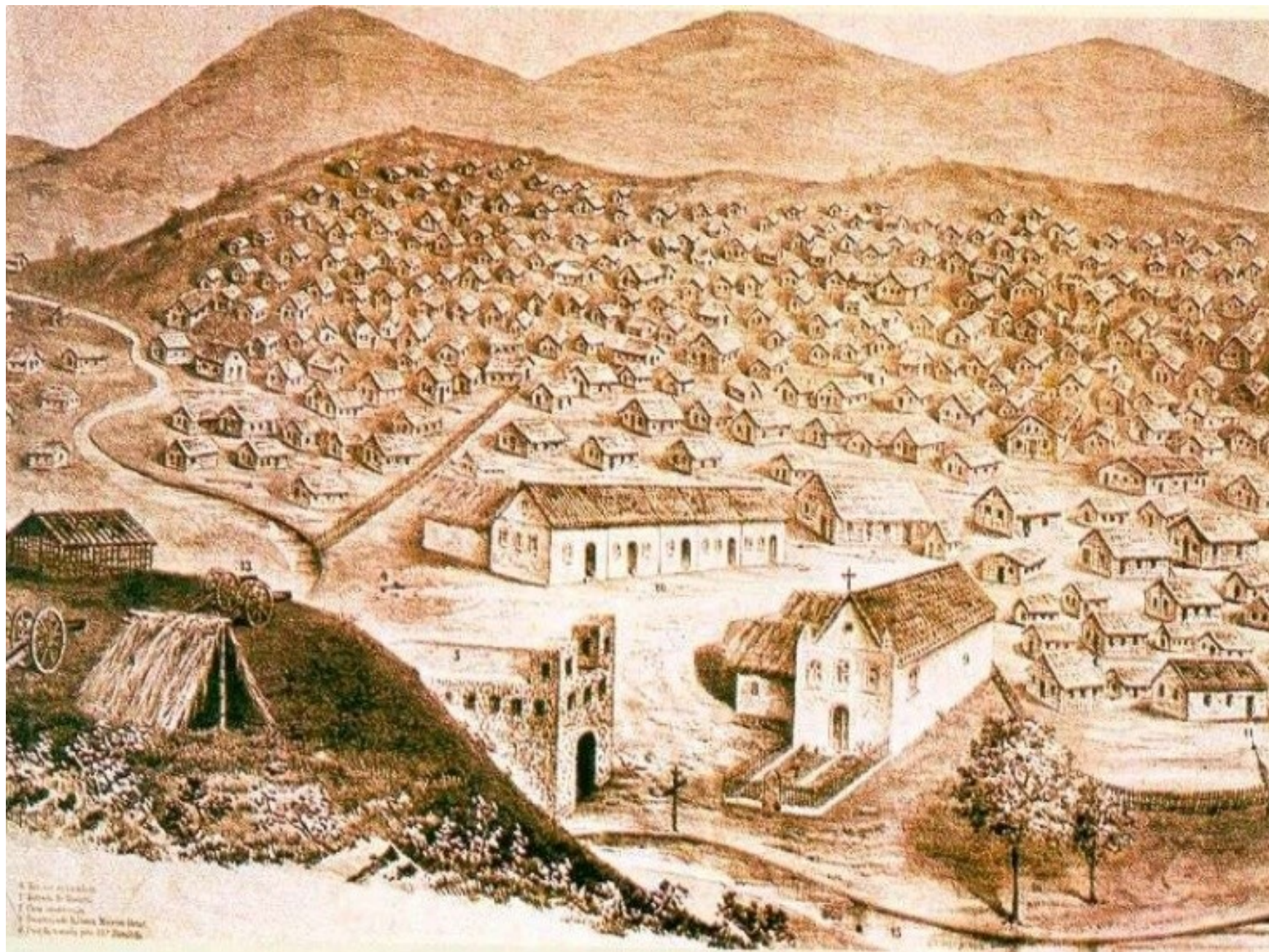
1. Iglesia de San Juan 2. Calle principal 3. Casa de la Municipalidad 4. Plaza de Armas 5. Casa de la Municipalidad 6. Casa de la Municipalidad