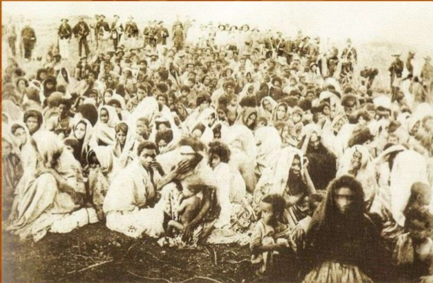
PRISIONEIRO DE CANUDOS; A MAIORIA ERA MULHERES E CRIANÇAS