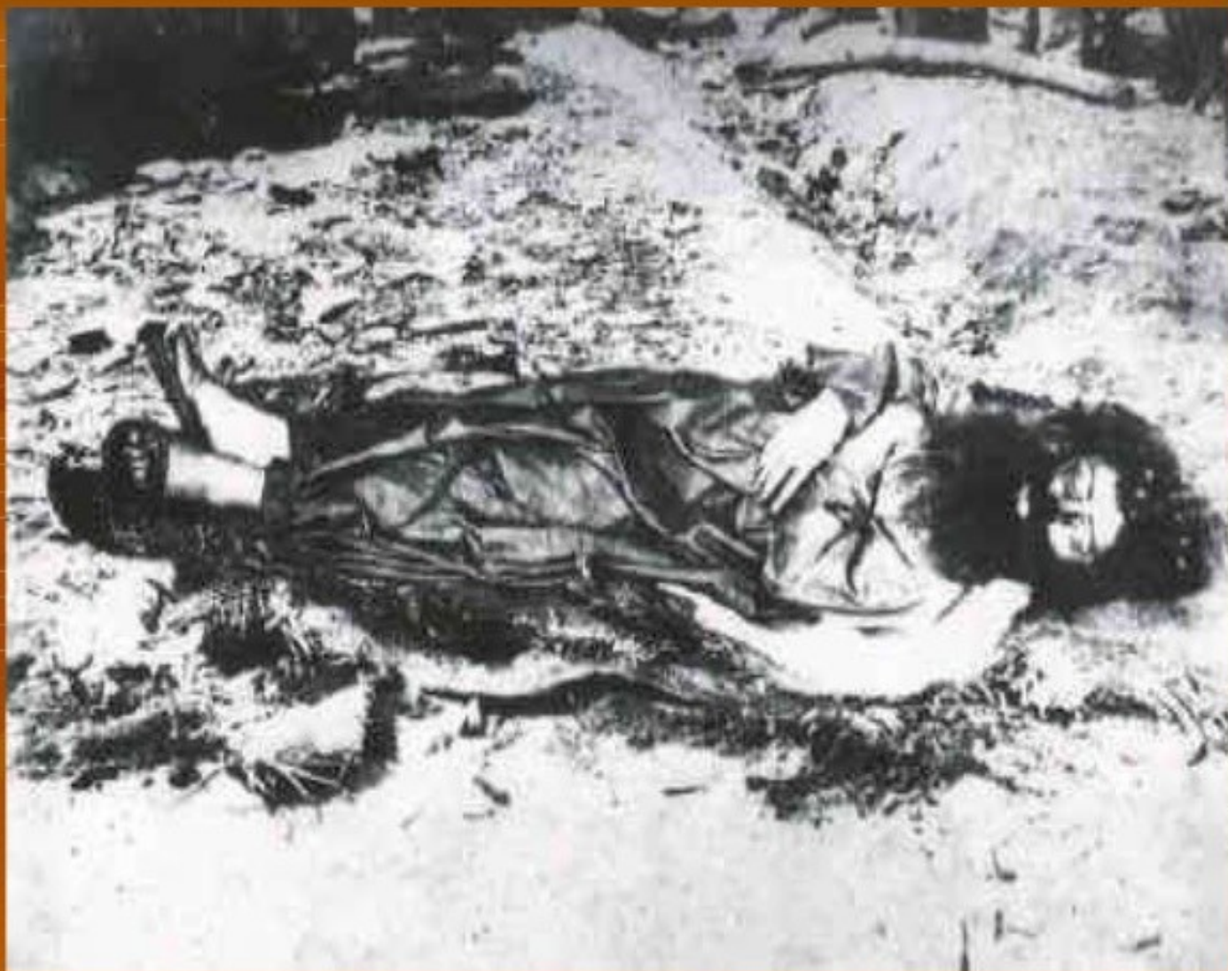
Única foto conhecida de Antônio Conselheiro tirada por Flávio de Barros no dia 6 de outubro de 1897.