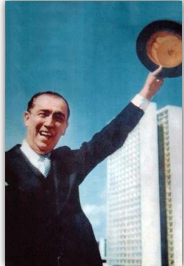
JK, o presidente bossa nova