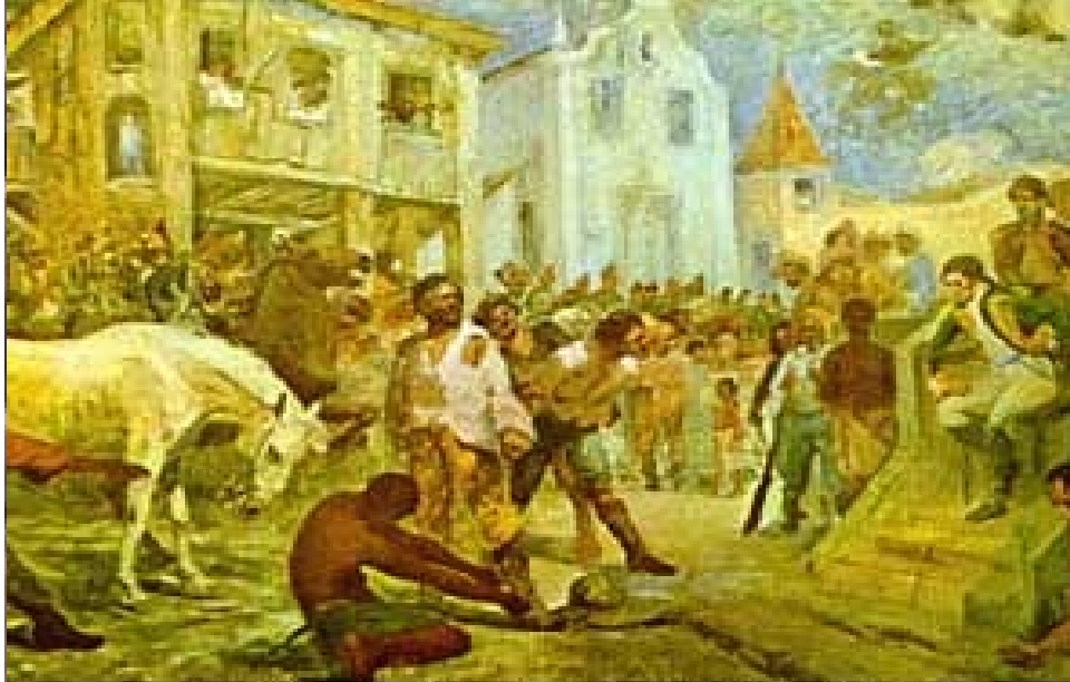
Imagem de Filipe dos Santos, líder da Rebelião Mineira de 1720